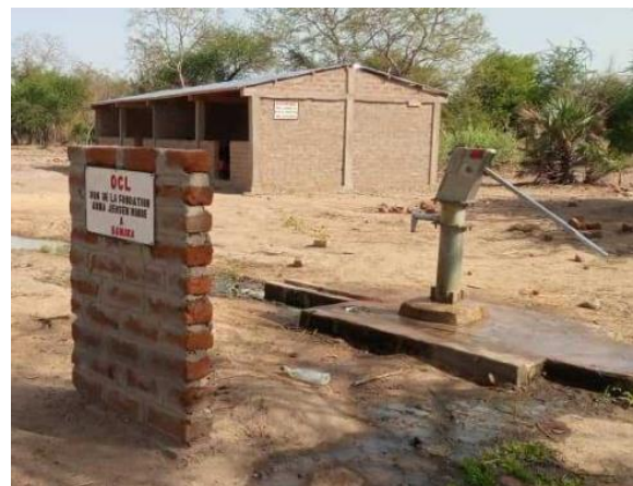
Satellittskole i Bainaka