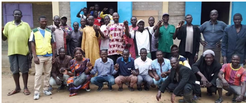
Lærere og foreldreutvalg samlet utenfor skolen

I 2022 ble det hovedsakelig satset på lokale lærere uten fagutdanning. Det viste seg at vi måtte supplere med noen utdannede lærere i løpet av året og en vakt som kunne se til barna i friminuttene. Lønningene lå litt over det tilsvarende skoler betalte og vi hadde enkelte klasser med godt over 100 elever. Før skolestart høsten 2023 fikk vi vite at maksimal størrelse på klassene er 50 elever, og at alle lærere måtte få en minimumslønn som var vesentlig større enn det vi tidligere hadde betalt. Uavhengig av bakgrunnen for innføring av disse kravene, var det en fantastisk mulighet for oss til å øke kvaliteten på skolen. Nå hadde vi fått støtte for å gi lærerne mer anstendig lønn og bedre arbeidsforhold. I september annonserte vi etter lærere på en regional radiokanal. Vi fikk mange søkere og vi ansatte 18 lærere for et nytt skoleår, mange av dem godt kvalifiserte med lærerutdanning.