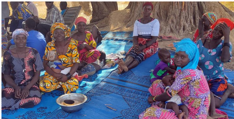
Kvinner i Mairoum. Bildet er fra januar 2022 og har ikke tilknytning til teksten.