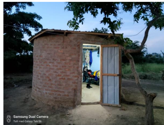
En av flere lærerboliger på skoletomten, finansiert og bygget av lokalbefolkningen.

OCL Norge har i samarbeid med lokalbefolkningen planlagt flere prosjekter for å oppnå fullstendig økonomisk selvstendighet og dermed uavhengighet av OCL's bistand. Det er fortsatt litt tidlig å si når dette vil skje, men vi jobber for å skape inntektsbringende arbeid ved skolen. Dugnadsbasert innsats ved syverksted, mursteinsproduksjon, isbit-produksjon, saueavl og skolemøbelproduksjon er noen av idéene som kan gi inntekter til skolen og nyttig kunnskap til de som gjør jobben.