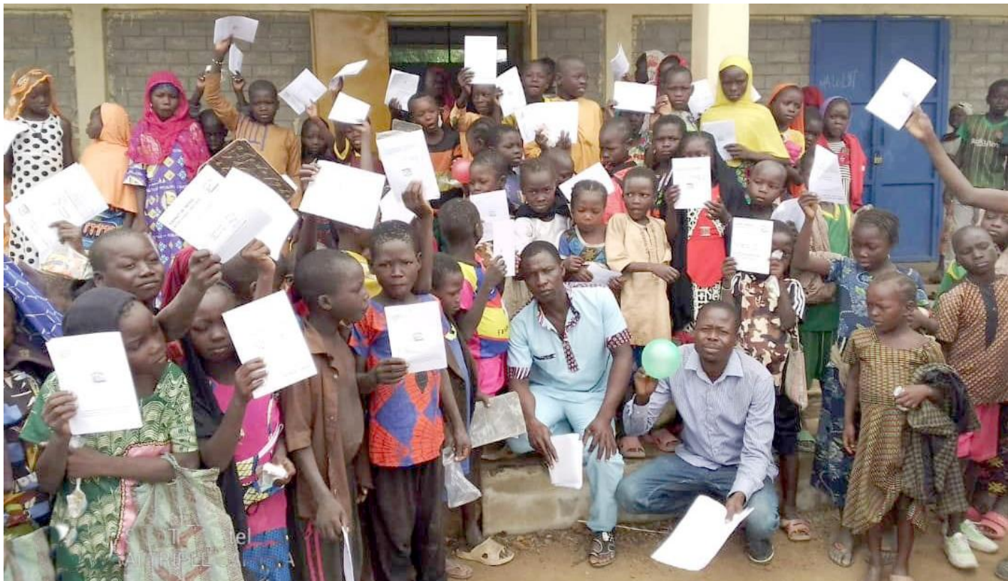
Stolte barn viser fram sine karakterkort etter fullført første skoleår. En like stolt rektor sitter på huk foran med en grønn ballong.