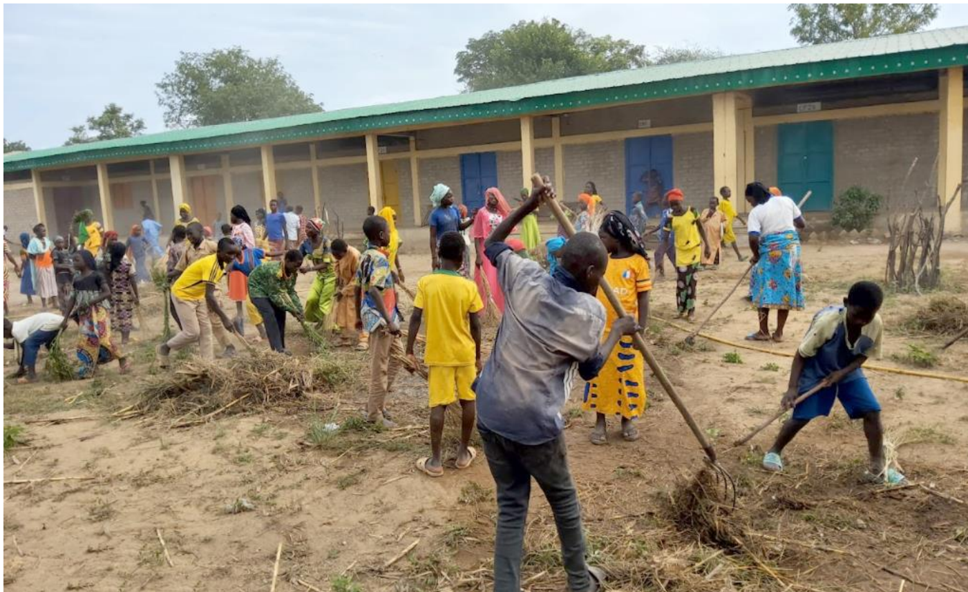
Dugnadsånden lever videre. Her rydder de skoleklassen etter at regntiden har fått gress og busker til å vokse vilt i sommerferien.