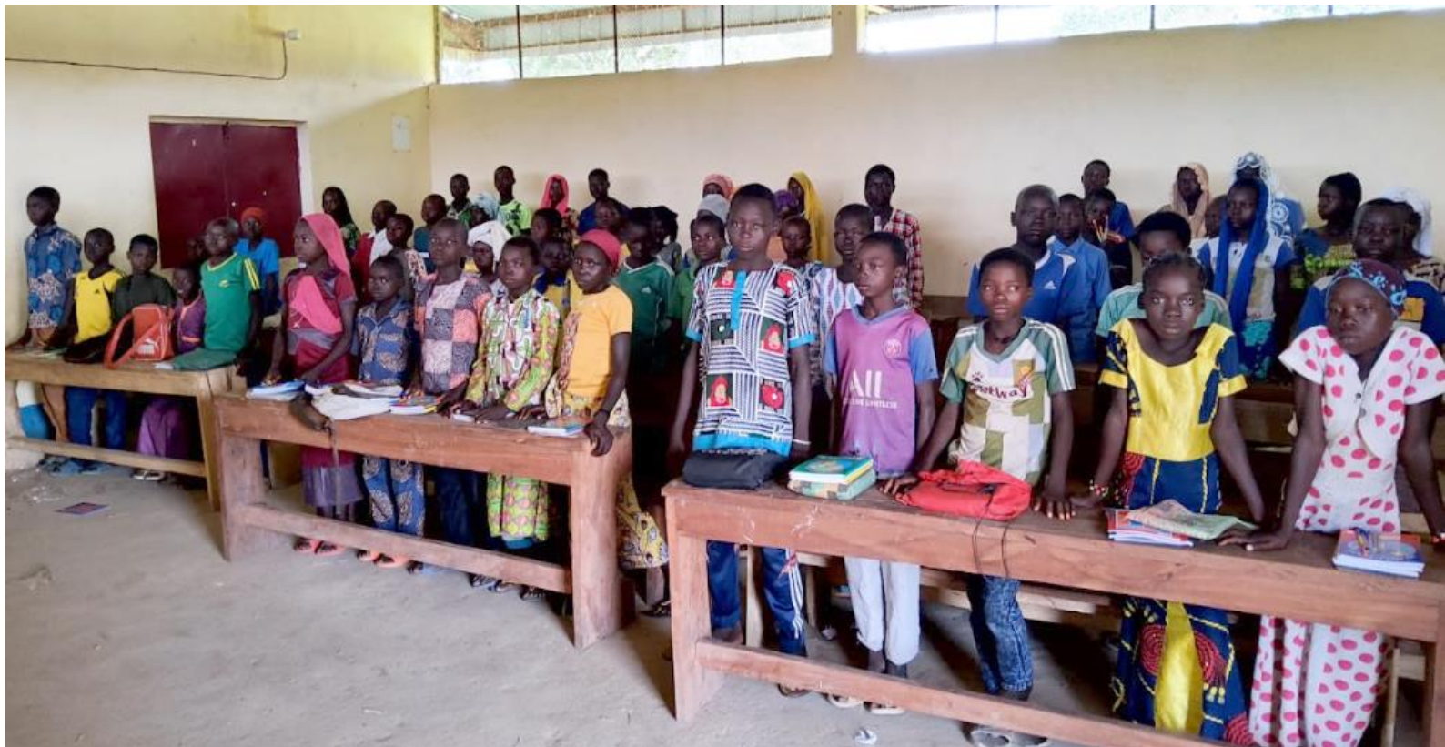
Elever i fjerde trinn. De har det største klasserommet og har stå de ved skolepultene som er utviklet av OCL og laget av foreldre og elever på dugnad.