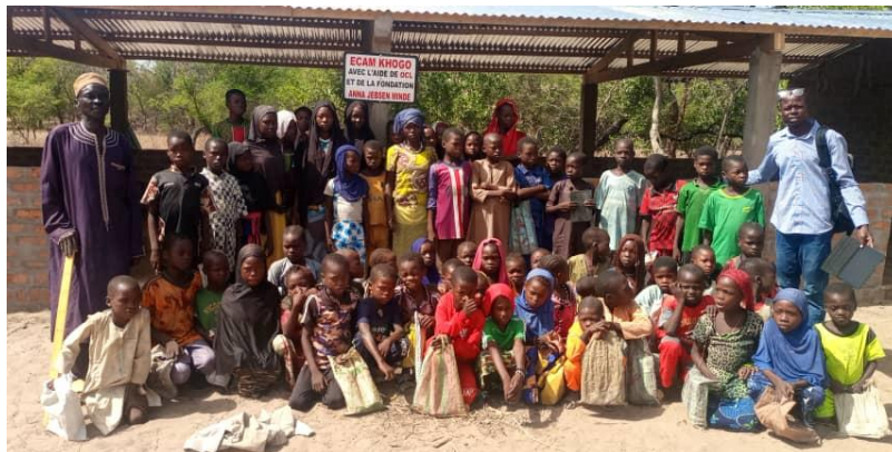
Satellittskole i Khogo

De tre satellittskolene har fått skolemateriell til både lærere og elever. Det har vi i tillegg bidratt med til to andre landsbyer hvor de fortsatt har skole under enkle stråtak. Gleden var ekstra stor i landsbyen Kissinga da det i november 2023 ble boret en brønn også der. Endelig kunne også de få drikke rent vann.