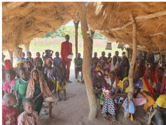
Provisorisk skole i Beyo