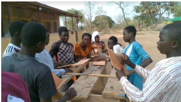
Elever i femte trinn lager skilt med navn på de ulike artene av grønnsaker og urter i skolens jordbruksprosjekt.

Det er radikalt med gratis skole for alle helt uavhengig av kjønn, folkegruppertilhørighet og familiens situasjon. Denne erfaringen vil barna ta med ut i arbeidslivet og eventuelt politisk liv senere. Det er også helt unikt at skolen kombinerer praktisk og teoretisk undervisning. Barna får opplæring i dyrking av jorda i den tørre årstid, knytning av fiskegarn, lokal byggekunst og tresløyd. Dette er ferdigheter som lokalsamfunnet har behov for i tiden som kommer.